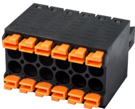
Twin connectors design, the pole number is half of the total connection points. photo shows a 12 connection product, the pole number is 06.